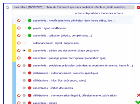
Check-list des étapes

(*) connecteur avec les solutions de convocations dématérialisées des élus (DocaPost - SRCI) (**) connecteur avec les parapheurs électroniques (DocaPost - SRCI) (***) connecteur avec les plateformes FAST (DocaPost) et iXBus (SRCI)