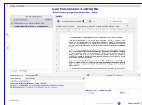
Circuits de validation